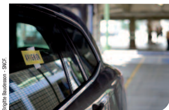
Brigitte Baudesson - SNCF